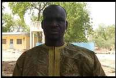
Pierre LIWARA Maire de la Commune de Yagoua